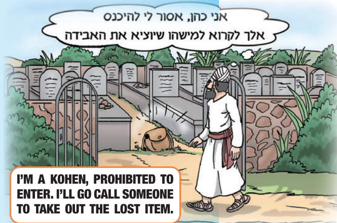
I'M A KOHEN, PROHIBITED TO ENTER. I'LL GO CALL SOMEONE TO TAKE OUT THE LOST ITEM.

מקרה א': פוהן בבית הקברות. התורה מצוה על הכוהנים שלא יטמאו בטומאת מת. לכן לכוהנים אסור להיכנס לבית הקברות. אם פוהן רואה אבדה בבית הקברות, אין הוא נכנס לבית הקברות כדי לקיים את מצות השבת אבדה, מפני שמצוה זו אינה דוחה את איסור הטומאה למת.