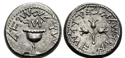
Silver shekel (CE 68) from 1st Jewish Revolt against Roman rule. FRONT: "Shekel of Israel/ Year 3"; BACK: "Jerusalem the Holy".

גורל הַבְּכוֹרִים: אַחֲרֵי חֲטָא הָעֵגֶל נִבְחַר שִׁבְט לְוִי לְעִבּוּדַת בֵּית הַמִּקְדָּשׁ בְּמִקּוֹם הַבְּכוֹרִים, לְפִיכָּה צִוְּיָה הַקִּבְּיָה לְפָדוֹת אֶת הַבְּכוֹרִים כְּנֶגֶד הַלְוִיִּים. מֵאֲחֵר וְהָיוּ יוֹתֵר בְּכוֹרִים מֵאֲשֶׁר לְוִיִּים לֹא נִתְּן הָיָה לְפָדוֹת אֶת כָּל הַבְּכוֹרִים כְּנֶגֶד הַלְוִיִּים ו-273 בְּכוֹרִים הָיוּ צָרִיכִים לְפָדוֹת אֶת עַצְמָם בְּכֶסֶף - חֲמִישֵׁה שְׁקֵלִים. גַּם כֵּן מֹשֶׁה עָרַךְ גּוֹרֵל לְקַבּוֹעַ אִילוֹ בְּכוֹרִים יְפָדוּ אֶת עַצְמָם בְּכֶסֶף.